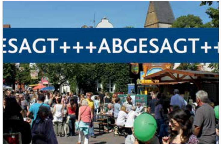
Stadt zieht schweren Herzens aufgrund der pandemiebedingten Planungsunsicherheiten die Reißleine für das HallerWillem-Stadtfest

Das Stadtfest Haller Willem findet auch in diesem Jahr nicht statt. Schweren Herzens hat die Stadtverwaltung das große jährliche Stadtfest zu Christi Himmelfahrt abgesagt, weil die Planungsunsicherheiten in der Pandemie zu groß sind, um eine Veranstaltung mit tausenden Besuchern verantwortungsvoll organisieren zu können. Damit wird das für den 12. und 13. Mai geplante Stadtfest wegen Corona zum zweiten Mal in Folge nicht stattfinden. Einen kleinen Trost gibt es aber: das Stadtmarketing plant für Juli und August mit dem „Haller Kultursommer“ ein neues Programm. „Auch, wenn man vor dem Hintergrund der Pandemieentwicklung damit rechnen musste, tut eine solche Entscheidung richtig weh, denn das Stadtfest Haller Willem ist ein Leuchtturm unseres städtischen Kulturlebens“, sagt Bürgermeister Thomas Tappe. Bis zuletzt hätten alle Beteiligten gehofft und alles versucht – „aber wir sehen heute leider keine Möglichkeit für einen Haller Willem.“ „Mit dem aktuellen Zeitfenster, die für die Organisation einer Großveranstaltung entscheidend sind“, erklärt Timo Klack, Leiter des Stadtmarketings. Jetzt müssten Verträge mit Künstlern, Ausstellern und Dienstleistern abgeschlossen werden, die im wahrscheinlichen