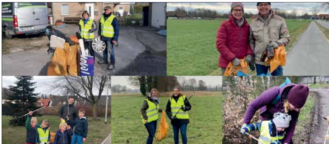
Müll sammeln ist Teamarbeit, in Künsebeck und anderswo ...