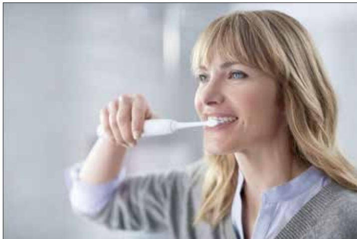
Die Zahnzusatzversicherung der Allianz lockt mit starken Leistungen und einer EasyClean-Zahnbürste als Willkommensgeschenk bei Vertragsabschluss

Unter diesem Motto empfiehlt sich der Versicherungsanbieter Allianz für seine Zahnzusatzversicherung. Dazu lockt zur Zeit eine dazu passende