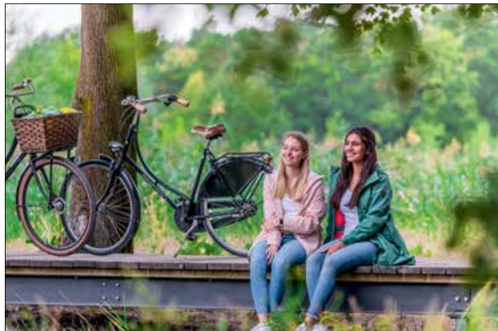
Passende Strecke finden und in die Pedale schwingen: Die Neuauflage der prowi informiert über abwechslungsreiche Radtouren

Radbrochure „Ziehen Sie doch mal wieder Kreise!“ neu aufgelegt. Nicht nur das frühlinghafte Wetter und die längeren Tage laden zu Radtouren durch den Kreis Gütersloh ein. Sondern auch zahlreiche abwechslungsreiche Strecken. Neun thematische Radrouten und fünf R-Radwege für gemütliche Touren am Feierabend, zum Wochenende oder für einen Kurzurlaub hat die prowi-GT nun in der überarbeiteten und neu aufgelegten Brochure „Ziehen Sie doch mal wieder Kreise!“ gesammelt. Die Radtourvorschläge versprechen Einblicke in die heimische Architektur und Botanik sowie in die Kultur und Geschichte im Kreis Gütersloh. Eine feine Welt, die es auf Strecken von 10 bis knapp 70 Kilometer Länge zu entdecken und zu erobern gilt. Gemütliche Abschnitte findet man in der Münsterländer Parklandschaft rund um Harsewinkel und Vermold. Entlang der malerischen SenneBäche, Wapel-, Roden- und Furlbach lässt sich der Fahrtwind ebenso genießen wie die unvergleichlichen Heide- und Sennelandschaften im Süden des Kreises. Die Ausläufer des „Teutos“ im Norden mit ihren anspruchsvolleren Touren garantieren stramme Waden und herrliche Weitblicke. Die Brochure ist gespickt mit sehenswerten Tipps sowie Einkehrmöglichkeiten am Wegesrand. „Zu jeder Route gehört zudem ein QR-Code, mit dem der GPX-Track direkt aus