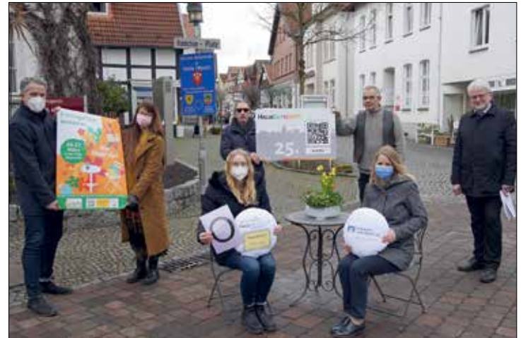
Frühlingsfrisch einkaufen - Hier klappt das: Stadtmarketing, Innenstadtmanagement, Haller Interessen- und Werbegemeinschaft und der Förderverein entwickeln gemeinsam eine Aktion für einen fröhlichen Frühlingsstart in Halle

Unter dem Motto „Frühlingsfrisch einkaufen. Hier klappt das!“ haben die Haller Interessen- und Werbegemeinschaft, das Haller Stadtmarketing, der Förderverein der Stadt Halle und das Innenstadtmanagement gemeinsam eine Frühlingskampagne entwickelt. Ob Geschäftsleute, Unternehmer oder Bürger – es sind wohl alle von der Hoffnung beseelt, dass alsbald wieder Normalität in unser gesellschaftliches Leben zurückkehrt. Mehr oder weniger sind