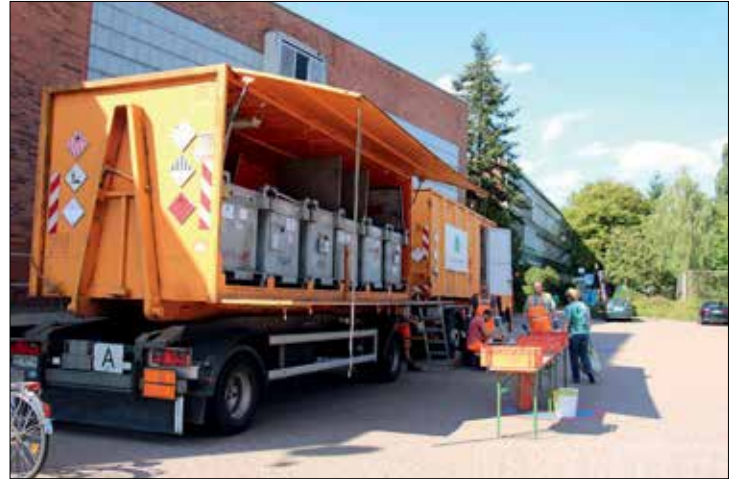
Das Schadstoffmobil in Kölkebeck, Parkplatz Berufskolleg Halle, Künsebeck, Hessel, Hörste und Bokel

Am 19. und 20. April haben Privatleute wieder die Möglichkeit, kostenlos Schadstoffe abzugeben. Das Schadstoffmobil wird von Fachkräften betreut, die die angelieferten Schadstoffe entsprechend ihrer chemischen Zusammensetzung sortieren. Um deren Arbeit zu erleichtern, werden die Bürger*innen gebeten, die Problemabfälle in der Originalverpackung abzugeben. Die Übergabe muss persönlich erfolgen.