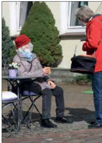
Erster Plausch in der Frühlingssonne – mit Maske und Abstand

der seine Künstlerwerkstatt in der Alten Lederfabrik betreibt, zehn zum Thema passende Skulpturen, die man an verschiedenen Stellen im Herzen von Halle entdecken kann. Und es gibt noch vieles Andere zu entdecken – wie die von den Haller Landfrauen mit Ostereiern geschmückten Bäume auf dem Rat-