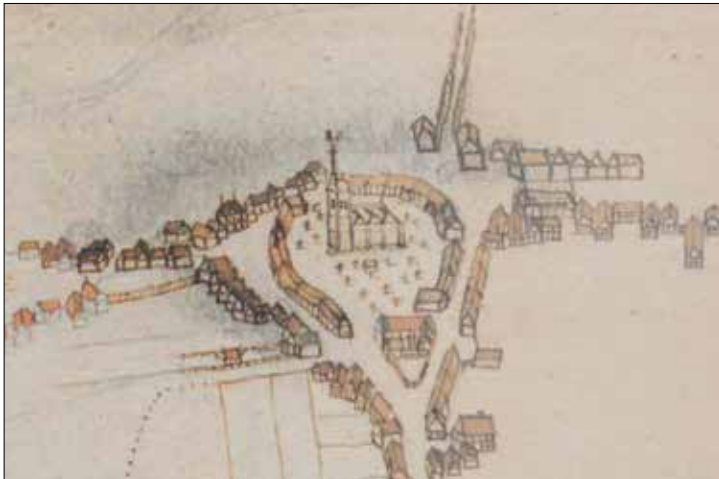
Spannende Karten von Halle: Das Virtuelle Museum „Haller Zeiträume“ zeigt unter anderem einen Kartenplan von 1780

Vor 80 Jahren, im Frühjahr 1941, sah Halle noch ganz anders aus... Einzelne Häuser reihten sich entlang der wenigen Straßen, hinter jedem Haus lag ein langer Gemüsegarten - und danach war die Welt schon fast zuende. Aber es gab große Pläne: Eine Umgehungsstraße, mehrere Neubaugebiete und große Industrieanlagen in Künsebeck. Was wurde davon tatsächlich umgesetzt?