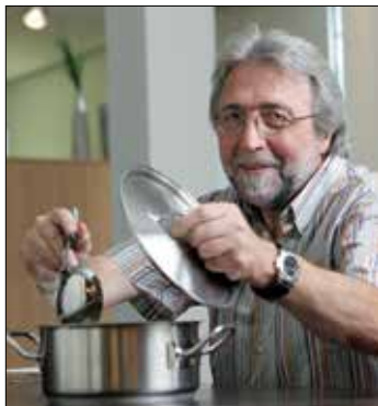
Für den April habe ich ....