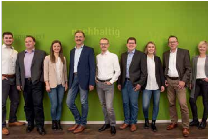
Die LVM-Versicherungsagentur Grüner gibt Verbrauchertipps

Das Leben ist aufregend, dynamisch und wertvoll, aber manchmal auch unvorhersehbar. Um seine Kund:innen jetzt noch besser bei Unfällen abzusichern, bietet LVM-Vertrauensmann Grüner in seiner Agentur in der Gartenstraße ab jetzt den neuen verbesserten LVM-Unfalltarif an. Der Versicherungsexperte erklärt die Besonderheiten des verbesserten Produkts: «Mit Hilfe der Absicherungen aus dem neuen Tarif können meine Kundinnen und Kunden nach einem Unfall direkt wieder ins Leben zurückfinden.» Neu sind dabei der Kinder-Premiumschutz, die Turbo-Progression, neue Altersstufen bei jungen Kunden und der Einschluss von Bänder- und Sehnenrissen.