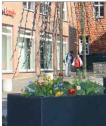
„Die Erde zeigt ihr Glück mit Blumen“

hausplatz, die in den Schaufenstern versteckten Ostereier und Buchstaben für die Haller Osterralley, den Kreuzweg auf dem Kirchplatz oder auch den HalleGutschein inklusive Bonus (wir berichten jeweils separat). „Wir hoffen, die frühlingshafte Deko bringt ein wenig gute Laune in die Innenstadt und animiert zum regen ‚Click and Collect‘ bzw. ‚Click and Meet‘“, freut sich der Vorstand der HIW über diese gut gelungene und fröhliche Gemeinschaftsaktion, die mindestens bis zum 30. April