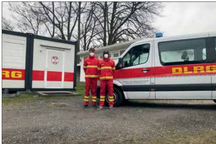
Seit Mittwoch, den 17.03.21 unterstützt die DLRG Halle mit ihren vier Bundesfreiwilligendienstleistenden die Transportfahrten zum Impfzentrum in Gütersloh